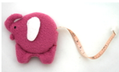
Messband – Elefant pink Fair Trade Handgefertigt Preis: 15.10 CHF / Stk. Bestellnummer: MB004