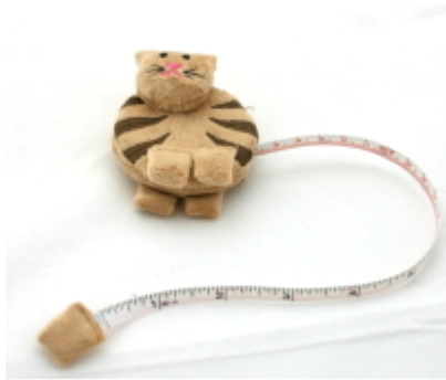
Messband - Katze Fair Trade Handgefertigt Preis: 15.10 CHF / Stk. Bestellnummer: MB002