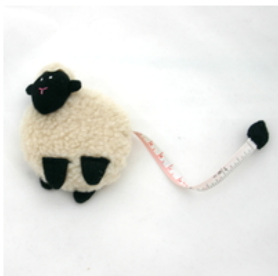
Messband – Schaf Fair Trade Handgefertigt Preis: 15.10 CHF / Stk. Bestellnummer: MB005